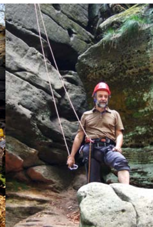
Klettern im Felsenpfad