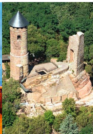
Schlossberg mit Burgruine